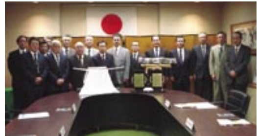
県民文化奨励賞贈呈式

当財団は、昭和58年に設立され、以来「奨学金の貸与事業」ならびに「文化活動に対する助成事業」を目的として活動しております。「奨学金の貸与事業」は、将来社会に貢献し得る人材を育成し、また、「文化活動に対する助成事業」は、地域社会における文化活動の活性化や振興発展に貢献された方々に、「県民文化奨励賞」を贈呈し功績を讃えております。