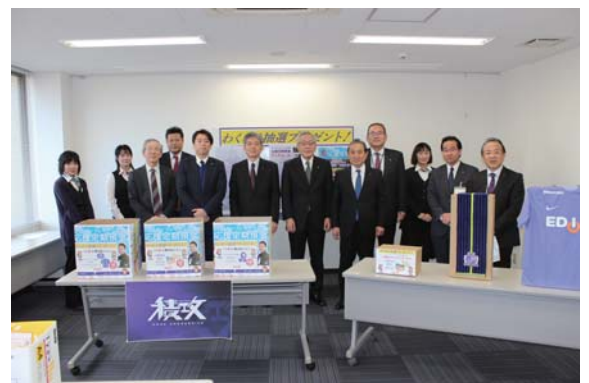
抽選会場：広島県信用組合 本店7階